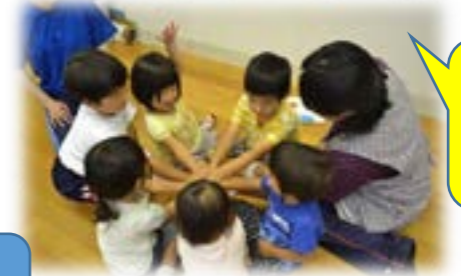
小学生のお兄ちゃん遊びに来てくれた