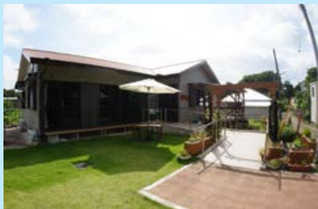
▲小規模多機能ホームたから

平成24年度から宝島においてのみ同サービスを介護保険適用下（相当サービス）としてスタートすることができ、今年、3年目を迎えることができました。これを記念しまして宝島で3周年記念イベントが開催されました。