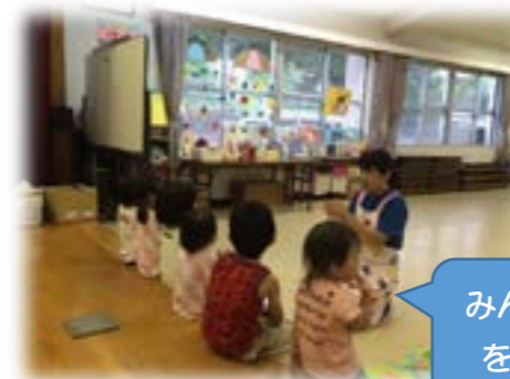
みんなでお歌を歌ったよ

口之島では4月より保護者の方々が主体となり「お集まり」を実施しています。お集まりの名前は、みんなで考え「くちっこハウス」とつけました。島ならではの自然いっぱいの中で楽しく遊んでいます。