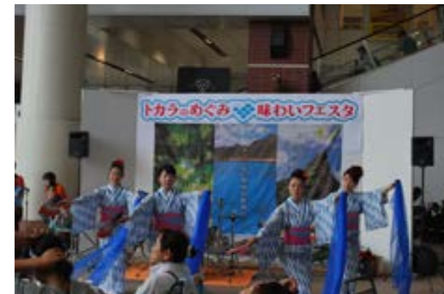
▲としまの歌に合わせた踊り