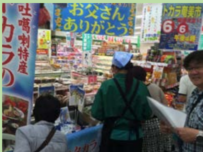
▲トカラ奄美市の様子

6月6日（土）、7日（日）に島間で旬の野菜・産物等を販売交換交流を行う「船上トカラ市」、奄美大島名瀬にて「トカラ奄美市」をNPO法人トカラ・インターフェイス主催で開催しました。大名タケノコやトビウオ等の特産品が出品され、多くの人で賑わいました。