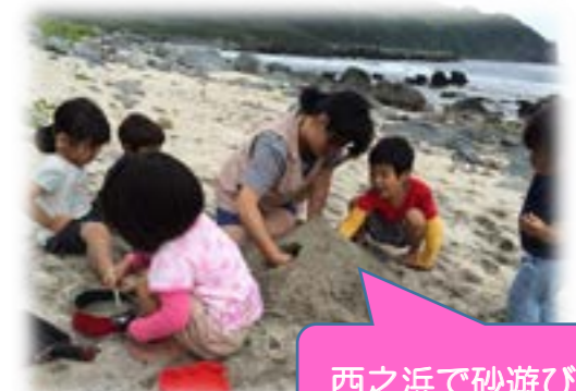
西之浜で砂遊び楽しいね