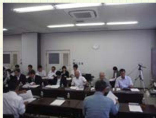
▲航路検討委員会の様子2