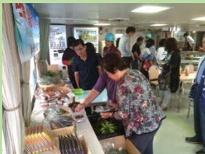
▲船上トカラ市の様子