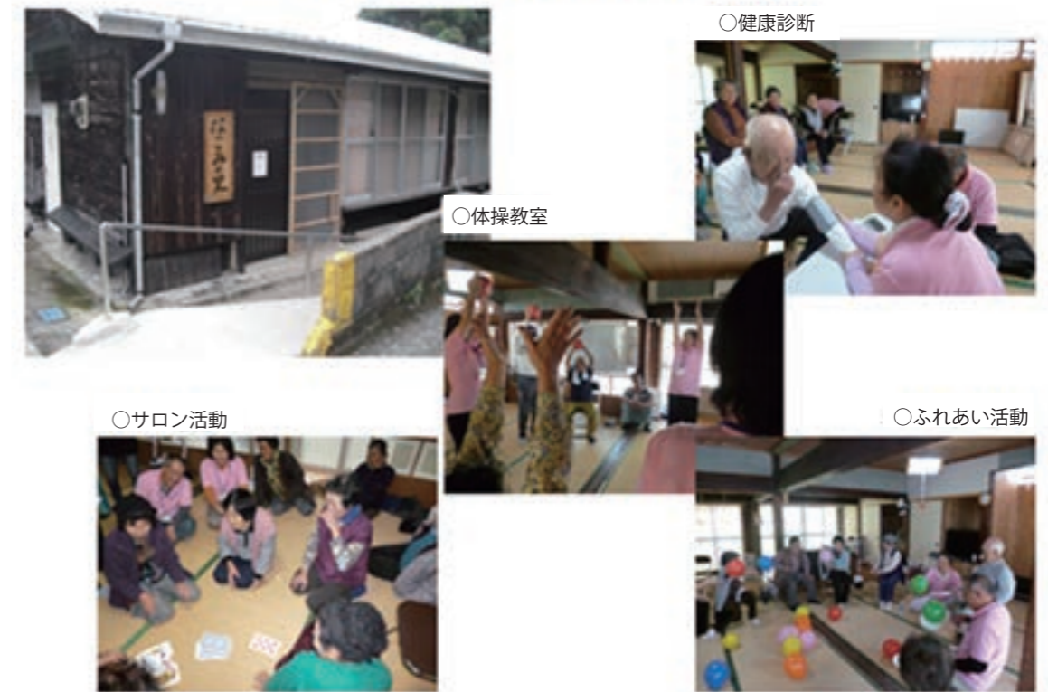
口之島「なごみの里」(サロン活動拠点)

<活動内容> 対象者の安否確認、短時間の話し相手、高齢者サロン活動の支援、巡回送迎、対象者の状況の記録及び報告、緊急時における連絡、会食等を実施。