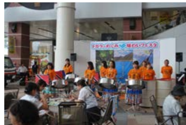
▲スティールオーケストラの演奏