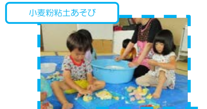
小麦粉粘土あそび