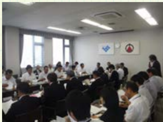
▲航路検討委員会の様子1