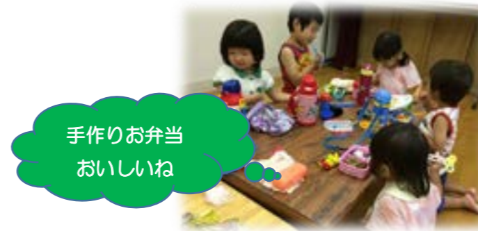
手作りお弁当おいしいね