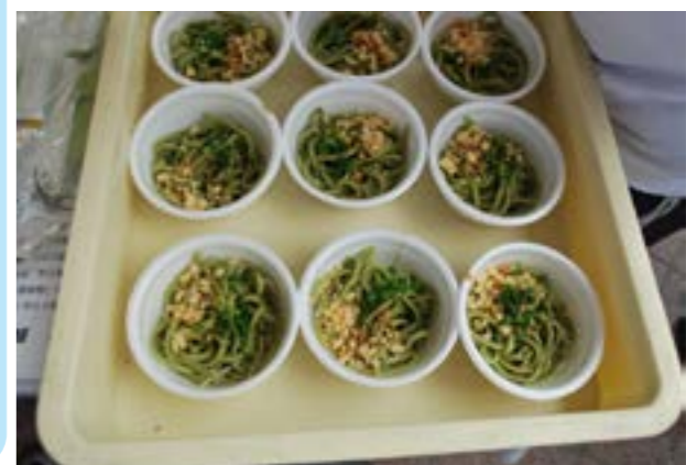
▲長命草うどんの試食