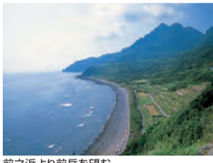
前之浜より前岳を望む