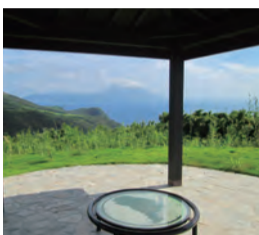
口之島タモコリ展望施設