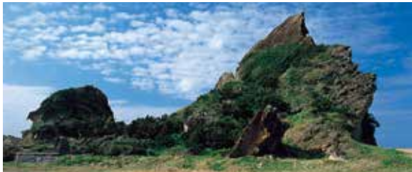
外ばんや・ばんや

隆起サンゴでできたこの島では、あちこちで奇岩を見かけます。その中でも、小宝島のシンボルでもあるうね神と言われる岩山は、まるでこの島を見守る神のような存在感です。