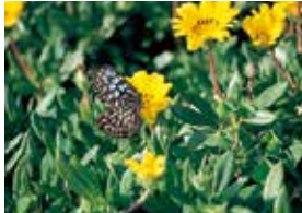
島のあちこちで蝶々が飛び交います