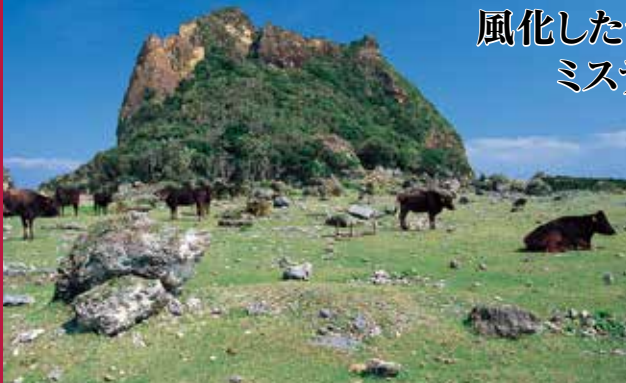
うね神と牛(南風原牧場)

隆起サンゴでできたこの島では、あちこちで奇岩を見かけます。その中でも、小宝島のシンボルでもあるうね神と言われる岩山は、まるでこの島を見守る神のような存在感です。