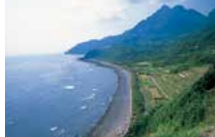
前之浜より前岳を望む