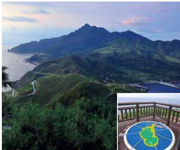
口之島フリイ岳展望施設

口之島の固有種で、他の種類のユリと違い、花は天を向いて開花し、香りが強い花です。名前の由来は平家の落人が種を着物の袂に入れて持ってきた説や球根を着物の袂に入れて持ち帰ったからとも言われています。