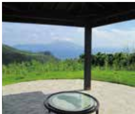
口之島タマトユリ展望施設