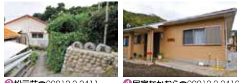
③松元荘 ☎09912-2-2411 ④民宿なかもむら ☎09912-2-2416

※民宿をご利用される方へ 各民宿とも、基本的には一泊三食付きで設定されています。 詳細は各宿に問い合わせ下さい。 なお、口之島では食堂などはございません。なるべく宿を利用されたほうがよろしいです。