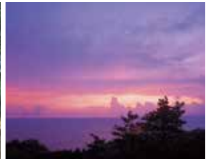
集落付近から夕日を望む