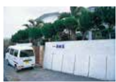
③民宿 浜坂荘 ☎09912-4-2204