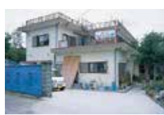
④民宿 サンゴ礁 ☎09912-4-2075