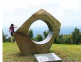
「美女とネズミと神々の島」記念碑

毎年旧暦7月16日に行われるボゼ祭りの前夜は、島の男衆による踊りが行われます。本番の明るく日は男衆による盆踊りが終わると、太鼓の合図で仮面神のボゼが現れます。赤土の付いたボゼマラと呼ばれる棒を持った来訪神であるボゼは、死霊臭がただよう盆から、人々を新たな生の世界へ蘇らせる役目を負っています。