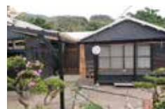
⑤旅の宿 十和丸 ☎09912-3-2107 携帯 080-1753-3225

※民宿をご利用される方へ 各民宿とも、基本的には一泊三食 付きで設定されています。 詳細は各宿に問い合わせ下さい。 なお、悪石島では食堂などはござ いません。なるべく宿を利用され たほうがよろしいです。車両を借 りたい方は民宿へご相談下さい。