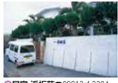
③民宿 浜坂荘 ☎09912-4-2204