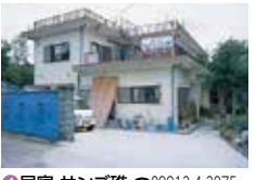
④民宿 サンゴ礁 ☎09912-4-2075