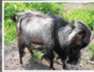
トカラヤギ/固有種