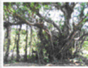
ガジュマル/民家の跡地に残る