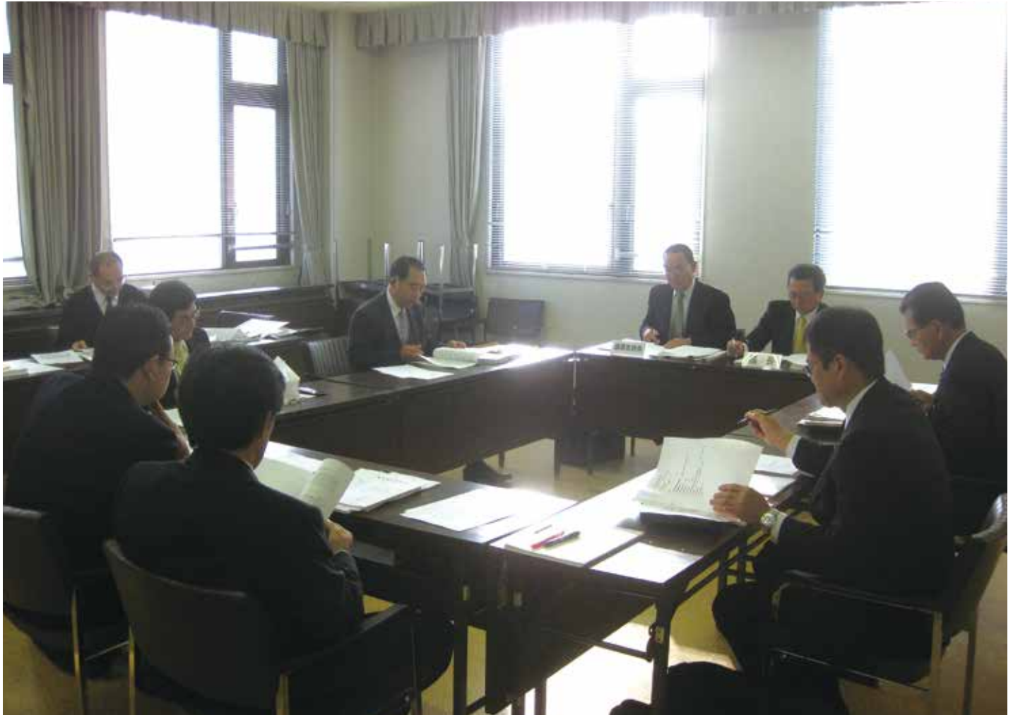
議会運営委員会風景