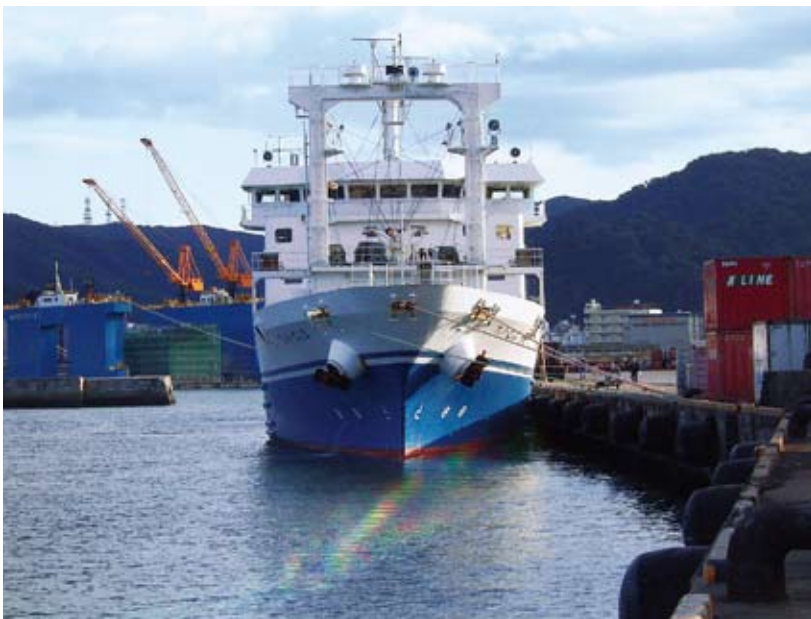
名瀬港係留中のフェリーとしま

○村長 県からは、今年度事業で申請してはというアドバイスもいただいたが時間的に困難なことから、平成21年度事業で申請してみようと考えており、部内でもそのように協議しております。