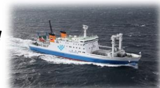
新船「フェリーとしま2」