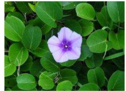
グンバイヒルガオ