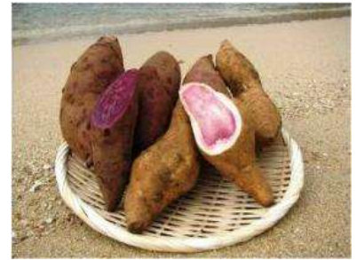
サツマイモ (芋づるも含む)