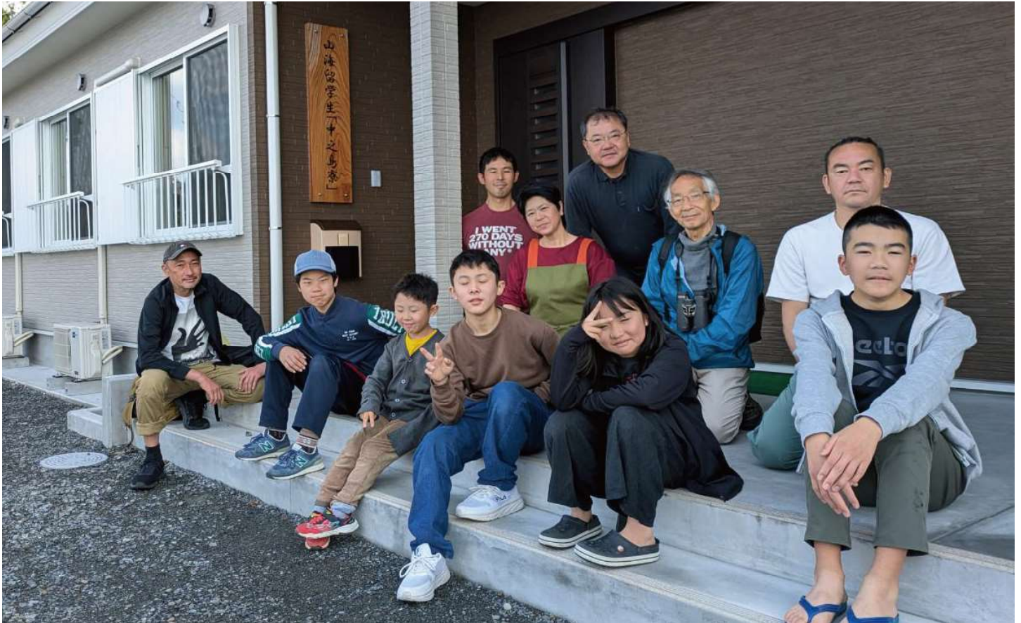
▲R7.4月に新設された中之島山海留学生寮にて

令和7年6月発行（年4回発行）Toshima Village 2025.6 No.109